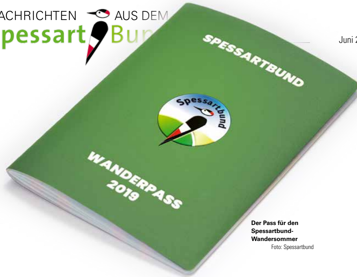
Der Pass für den Spessartbund-Wandersommer