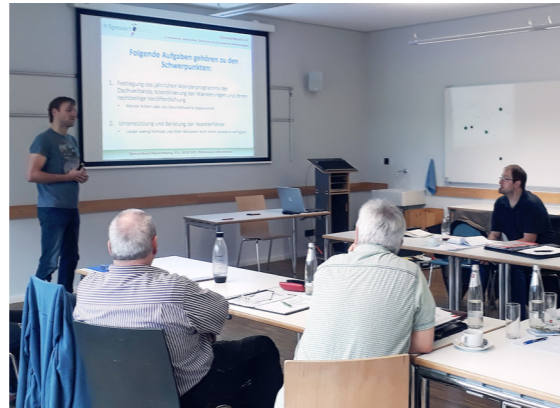
Spessartbund-Klausur in Oberelsbach (Rhön).

Mit den vielfältigen Aufgaben und deren effizienter Bearbeitung im Team befassten sich die Teilnehmerinnen und Teilnehmer im zweiten Teil des Seminars unter Leitung von