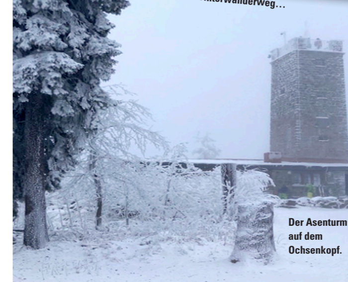
Der Asenturm auf dem Ochsenkopf.

Bischofsgrün. Etwa 30 Wanderer mehrerer Ortsgruppen des Spessartbundes nahmen auf Einladung des Deutschen Wanderverbandes am 5. Deutschen Winterwandertag vom 18. bis 22. Januar 2023 im Fichtelgebirge teil.