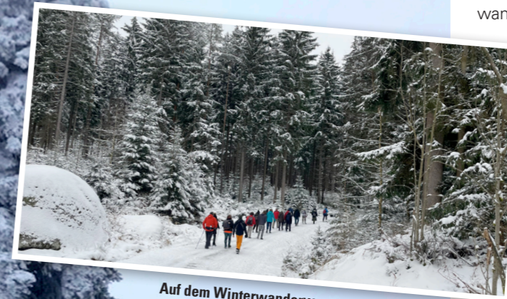
Auf dem Winterwanderweg...