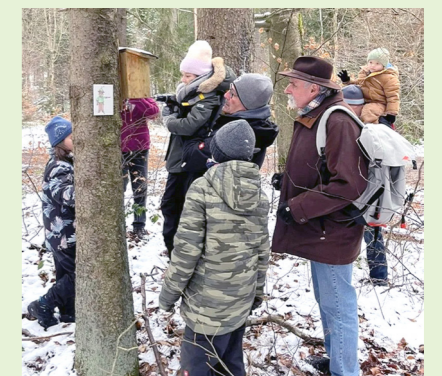
Gemeinsam bekommt man jeden Nistkasten sauber.