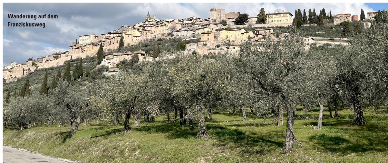
Wanderung auf dem Franziskusweg.

Anmeldung: Favaro's Touristik GmbH, Im Weihergarten 12, 63584 Gründau-Breitenborn, Telefon: +49 6058 1096, Telefax: +49 6058 1367, E-Mail: kontakt@favaros-touristik.de Informationen unter: www.favaros-touristik.de sowie unter https://spessartbund.de/24-09-03-10-2023-franziskusweg