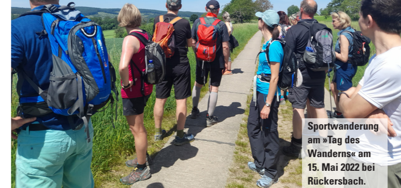
Sportwanderung am »Tag des Wanderns« am 15. Mai 2022 bei Rückersbach.

Rückersbach. Die letzte von sechs Sportwanderungen, die die Naturfreunde Rückersbach gemeinsam mit Spessartbund und Naturpark Spessart angeboten hatten, führte auf 24 km rund um den Hahnenkammsee zum Johannesberger Adventszauber. Viele der 26 TeilnehmerInnen hatten nach dem Rundweg über Reichenbach, Hohl, Großhemsbach, Hahnenkammsee, Kleinhemsbach, Stempelstelle, Gunzenbach, Hutzelgrund und Reichenbach den Eindruck, die ganze Zeit bergauf gelaufen zu sein, waren doch zusammen 800 Höhenmeter zu bewältigen. Da schmeckten Glühwein und Bratwurst umso besser, wurde doch ohne die kurzen Pausen eine Durchschnittsgeschwindigkeit von 5,3 km pro Stunde errechnet. Damit war diese Sportwanderung sowohl die mit den meisten TeilnehmerInnen wie Höhenmetern. Dieses Mal hatte der Rückweg mit Nebel und Dunkelheit besondere Reize, erst recht für die beiden Wanderhunde, die die Gruppe begleiteten.