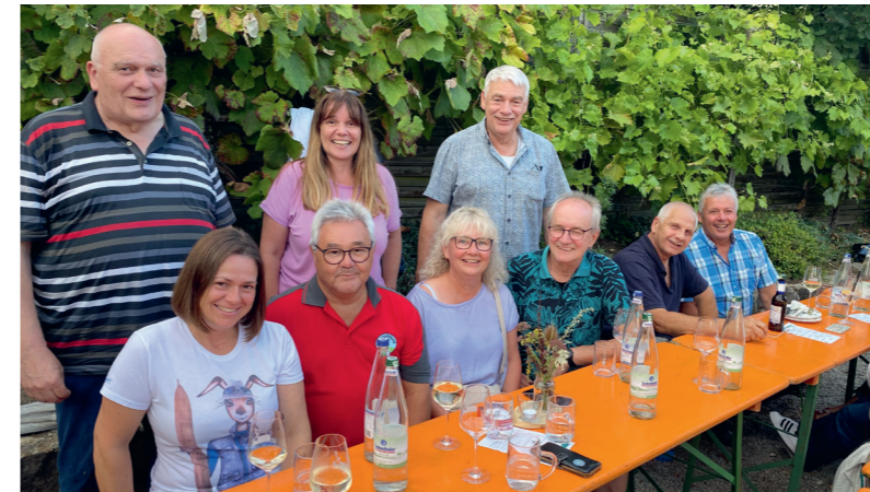
Die Vorstandschaft des Vereins Laudenschbach empfängt herzlich die Abordnung des Spessartbunds.

Weitere Infos unter www.spessartverein-offenbach.de