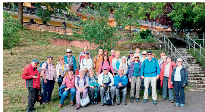
Die Offenbacher Wanderer vor dem Waldhotel Heppe.

Spessartverein Offenbach wanderte zur Geißhöhe