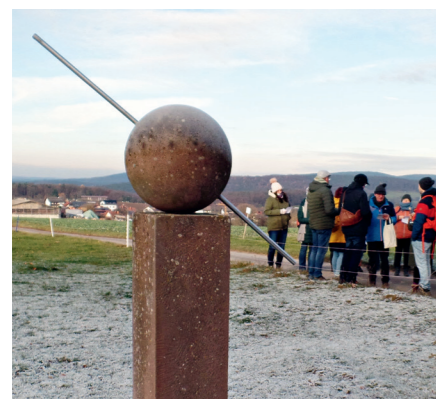
Dornau Weltachse: Die Führung endete am Weltachsendenkmal, wo sich die Gruppe zu einem gemeinsamen Abschluss versammelte.

Zurück im Bürgerhaus erwarteten die Besucher Uhr Kaffee und Kuchen