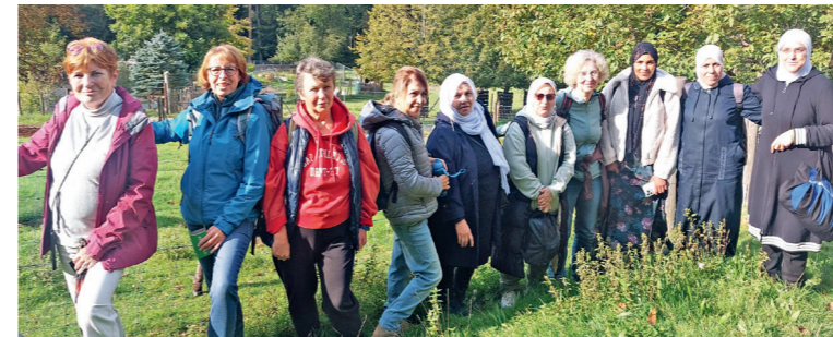
Gruppenbild im Haibacher Wildpark.