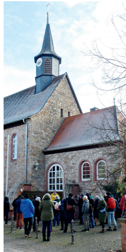
Für die Dornauer ist die Wendelinuskirche Herz- und Schmuckstück