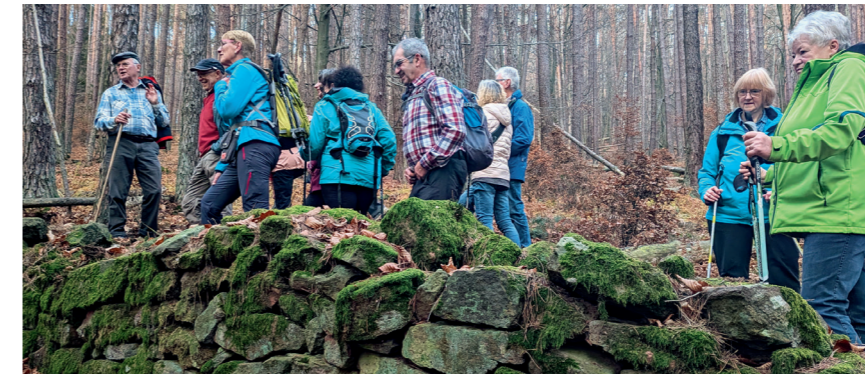
An der Heimbuchenthaler Wildmauer